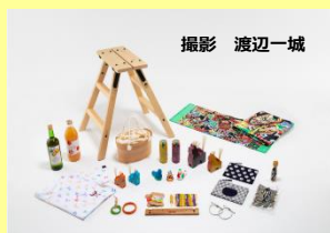
R3年度の事業で生まれた新商品