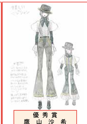
優秀賞 鷹山 沙希