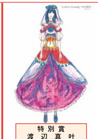
特別賞 渡辺 真叶