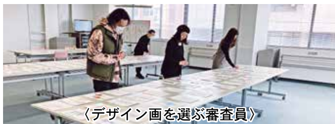
〈デザイン画を選ぶ審査員〉