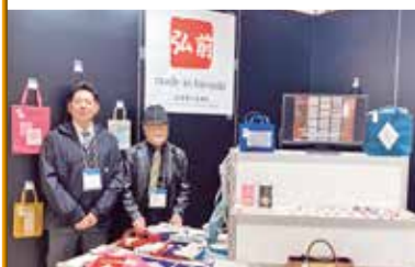
〈出展ブース：（有）弘前こぎん研究所〉

今回のギフト・ショーは、実質的にコロナ後初の開催となり、出展者、入場者とも昨年を大幅に上回った名目通り「日本最大のパーソナルギフトと生活雑貨の国際見本市」であったので、今後、出展した両社にとって有効な取引が成立することが期待されます。 <地域・産業振興課>