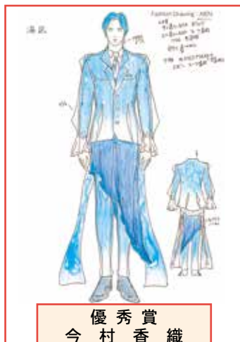
優秀賞 今村 香織