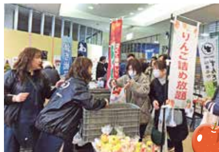
〈人気のりんご詰め放題〉