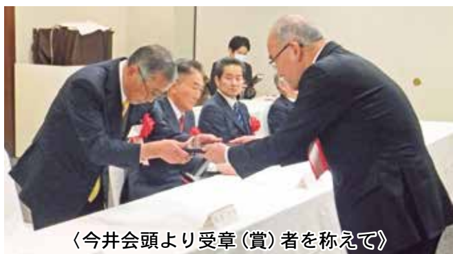
《今井会頭より受章(賞)者を称えて》