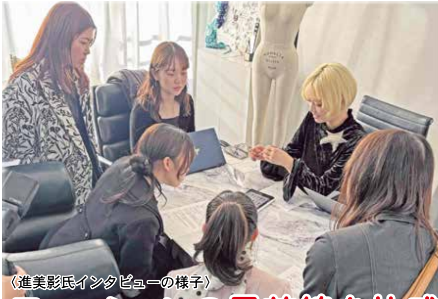
〈進美影氏インタビューの様子〉