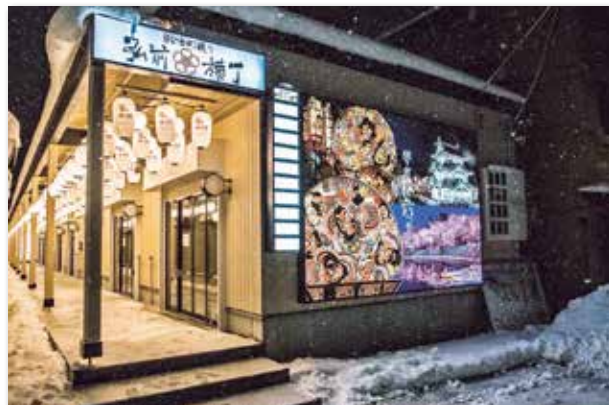
〈新しく完成した「弘前横丁」〉