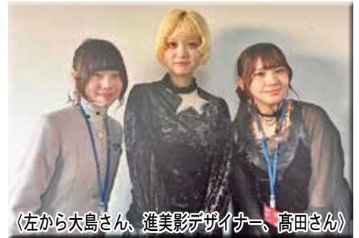
〈左から大島さん、進美影デザイナー、高田さん〉