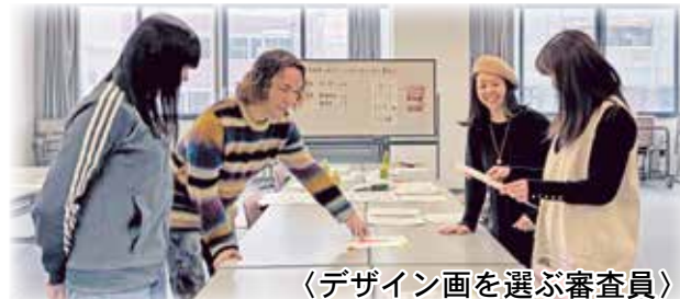
〈デザイン画を選ぶ審査員〉

「苦しい日常」の中でも「お風呂は自分が一番の主役になれる場所」というストーリー性が面白い。テーマに反して黒などの暗い色を一切使わず、入浴剤をイメージしたパステル調の「幸せカラー」で世界観を統一している感覚がいい。プラスチックの透明感やタイルの質感、スポンジのふわふわした素材感などを1枚のシートから見事に表現する「読み取る力」が飛び抜けて素晴らしく、お風呂の栓をアクセサリーに見立てたり、シャワーカーテンのようなヒラヒラしたレースを用いたりする細部へのこだわりがユニークで可愛い。作品の裏側に「スポンジをかける場所」まで作り込むなど、一つ一つの要素に物語を詰め込んだ徹底ぶりを感じる。また、水中をイメージした遊び心のある構成を高い技術で形にした全体的な完成度が素晴らしい。