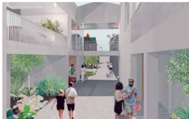
〈土手町テラス外観イメージ〉

「土手町テラス」は現在、入居希望者を募集しています。ご興味のある方は下記までお問い合わせください。