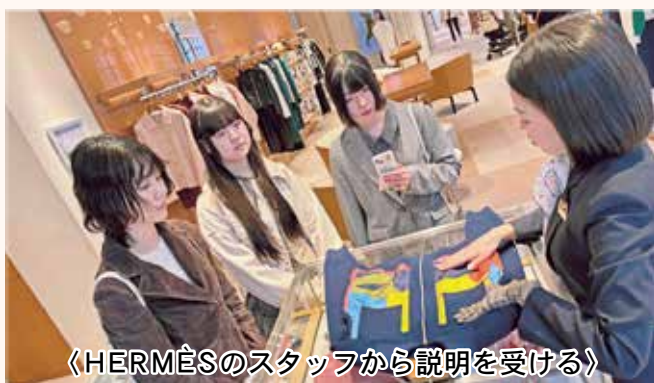
《HERMÈSのスタッフから説明を受ける》

続いて「Rakuten Fashion Week TOKYO 2026」の「ANTHEM A」のショーを見学。