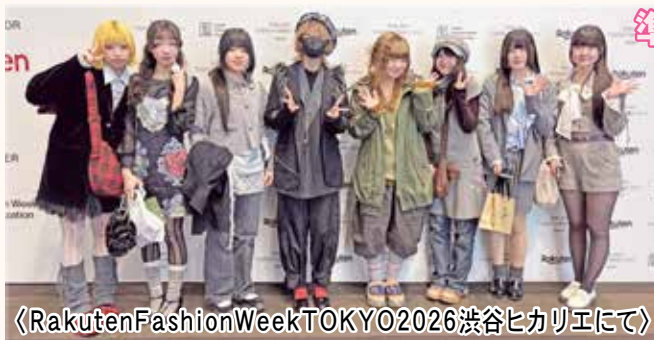
《Rakuten Fashion Week TOKYO 2026渋谷ヒカリエにて》